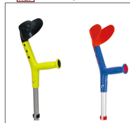
Herdegen Kinder Gehhilfen Tiki REF 200522 / 200523