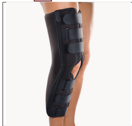
BORT Immob-Schiene mit Patella-Aussparung REF 145000