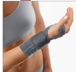
BORT Handgelenkstütze mit Alu-Schiene und Band REF 103301