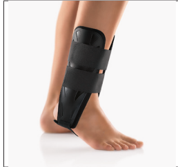
BORT MalleoStabil® -Orthese REF 100500