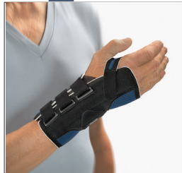
BORT Generation Handgelenkorthese REF 215100