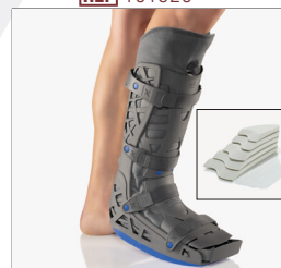
BORT X-Walker Achillo REF 101320