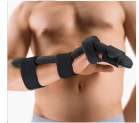
BORT Dorsale Intrinsic Plus Schiene REF 102500