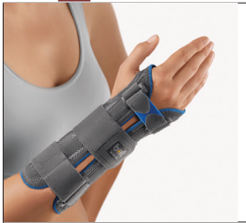
BORT Manustabil® REF 102200