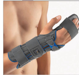
BORT ManuCarpal® Combi REF 102400