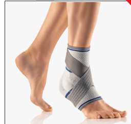
BORT TaloStabil® ECO NEU REF 054650