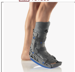
BORT X- Walker kurz REF 101350