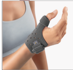
BORT SellaFix® Mittelhand-Daumenschiene REF 112040