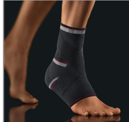
BORT select® TaloStabil®Plus REF 054100