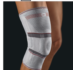
BORT select® StabiloGen® REF 114420