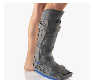
BORT X- Walker Achillo zur prä- oder postoperative Ruhigstellung