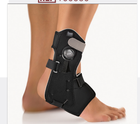
BORT MalleoXpress Active REF 100580