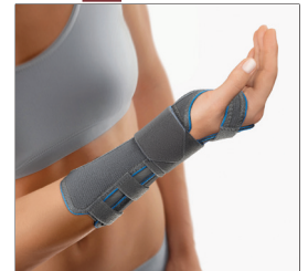
BORT Arm- und Handgelenkschiene REF 103580