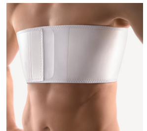
BORT Rippengürtel zur Unterstützung bei Rippenfraktur