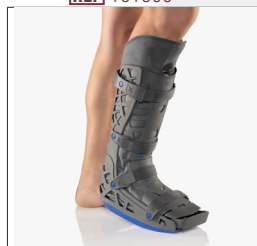
BORT X-Walker lang REF 101300