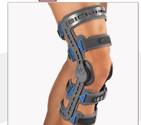
BORT GenuXpress REF 100700