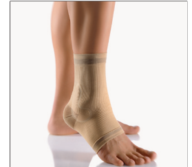
BORT activemed Knöchelbandage REF 220600