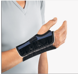
BORT Generation Handgelenkbandage REF 215000