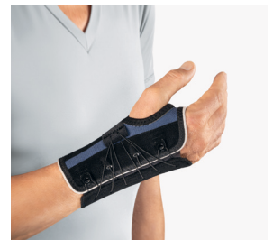
BORT Generation Handgelenkbandage zur Stabilisierung des Handgelenkes