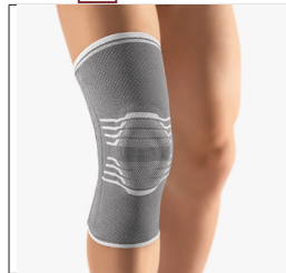
BORT activemed Kniebandage REF 220400