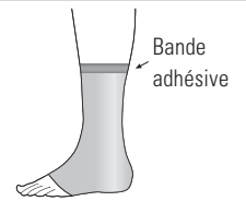
Schéma de mesures

Délai de livraison env. 10 - 12 jours ouvrables.